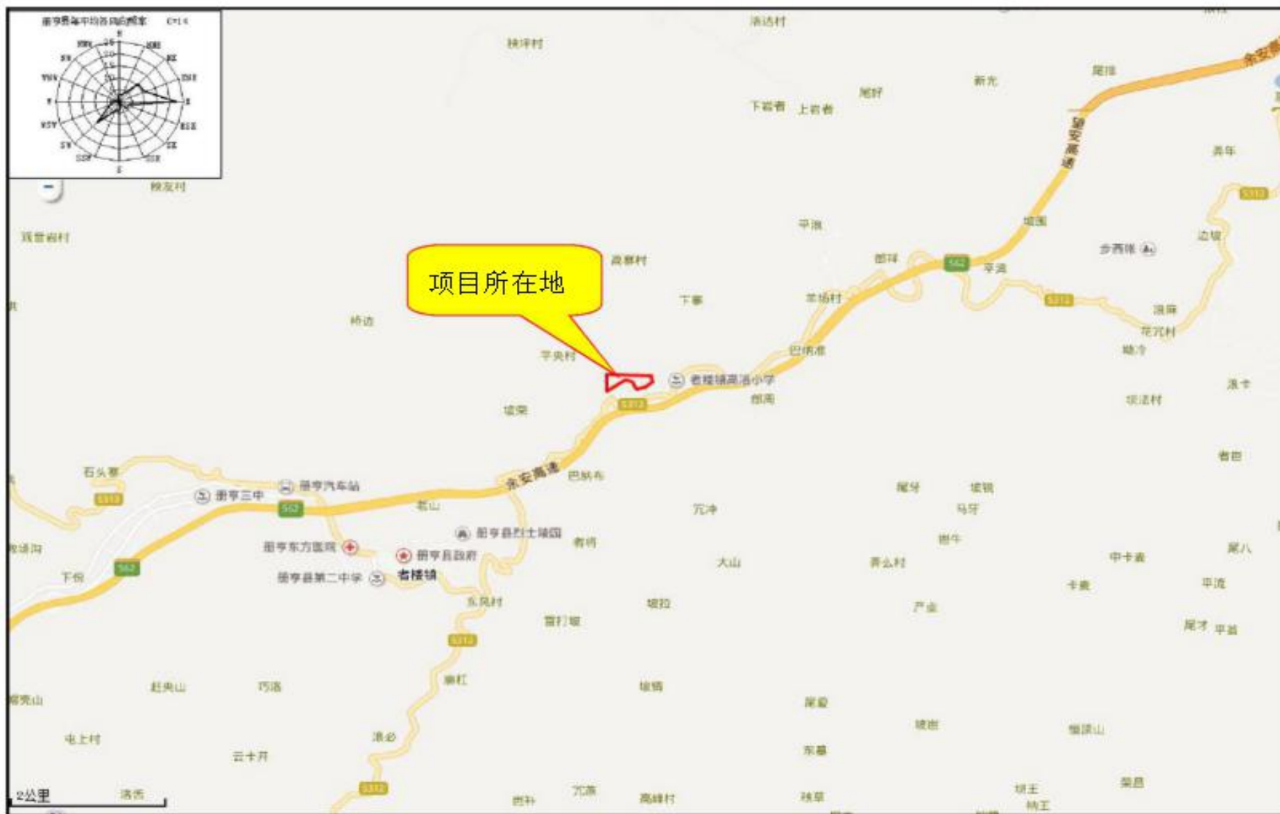
附图 1 项目地理位置图