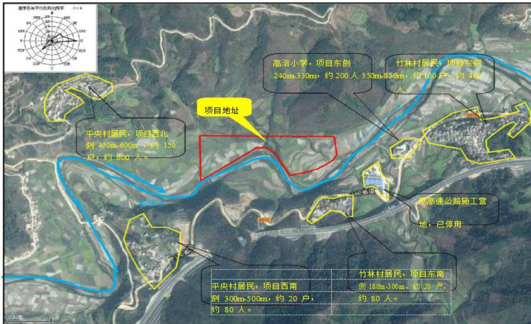
附图 2 项目外环境关系图